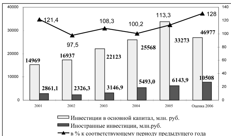
Динамика инвестиций в 2001-2005 гг. и оценка 2006 г.

В структуре промышленного производства области преобладают обрабатывающие производства, отличающиеся высокой энергоемкостью и фондоемкостью, дающие наибольший прирост объемов производства — 111,3%. Перерабатывающая промышленность в регионе представлена производством полупродуктов с небольшой добавленной стоимостью, вывозимых на пределы области для конечных стадий переработки — алюминий (34 % производимого в стране), целлюлоза (30 %), синтетические смолы и пластмассы (53%), круглый лес (17 %) и пиломатериалы (10 %).