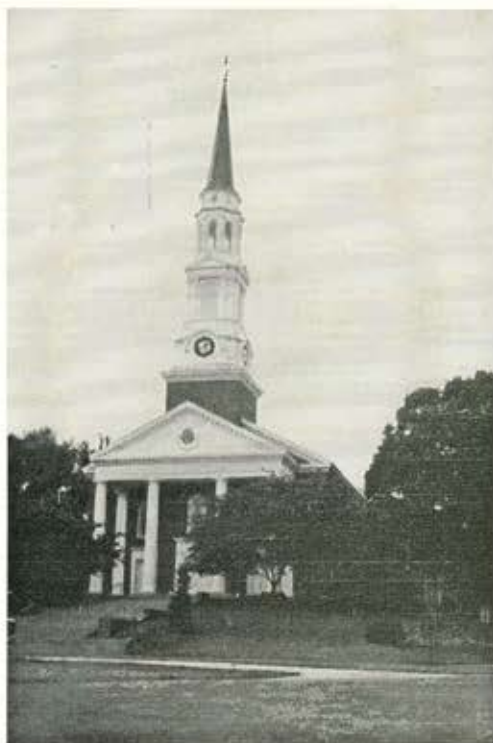
Церковь на территории университета

И, наконец, последнее, что было отмечено на обсуждениях — это высокий уровень технологий, используемых в американских компаниях. Компании постоянно следят за новейшими разработками компьютерных программ и средств коммуникаций (выписывают журналы, посещают семинары). Быть на вершине технологического прогресса — необходимое условие для выживания компании среди жесткой конкуренции.