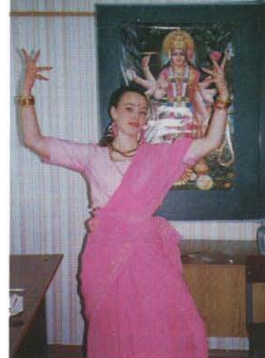
Танец Шива как метафора для изучения индийской культуры (один из видеорефератов студентов 2 курса)

А вот мнение победителей (студентов, которые заняли первое место в презентациях видеорефератов):