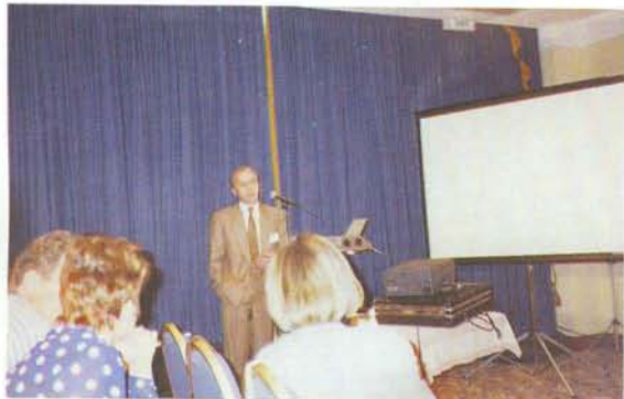
Выступление директора БУК на пленарном заседании РАБО