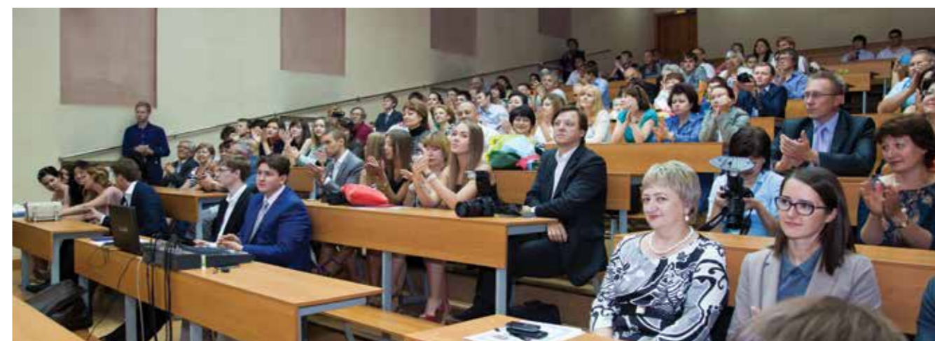
Выпускной вечер бакалавров. Закончили бакалавриат (первую ступень высшего образования) по направлению «Менеджмент» 43 человека, из них 11 – дипломы с отличием.